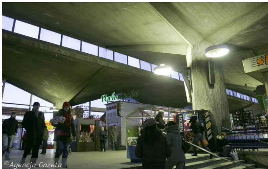
Słynne „kielichy” dworca katowickiego. Niestety niedługo przestaną istnieć...

Przewodnicząca Komisji Architektury XX w. PKN ICOMOS