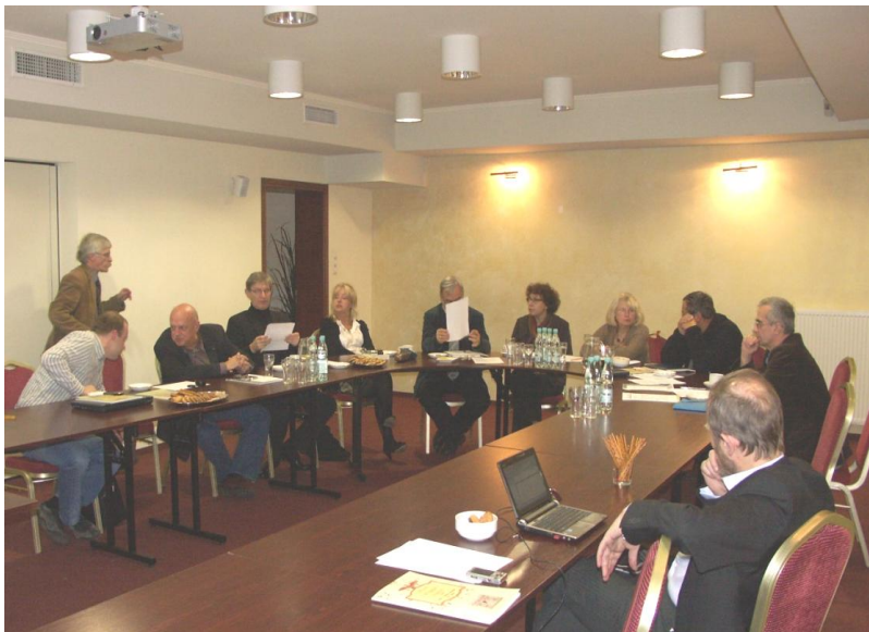
Seminarium KAM w Nałęczowie 23-24.10.2010 - obrady