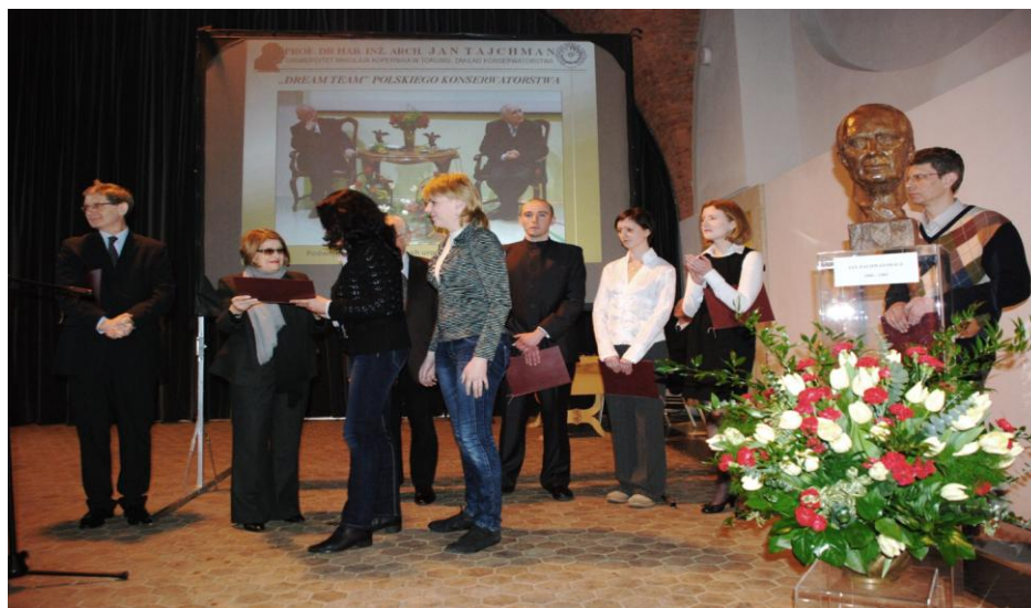
Nagrody w konkursie im. J. Zachwatowicza w 2009 r., wręczane na Zamku Królewskim w 2010 r.