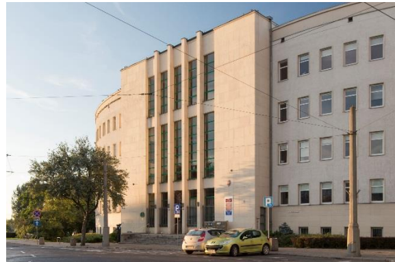
[RH; fot. Bartłomiej Ponikiewski]