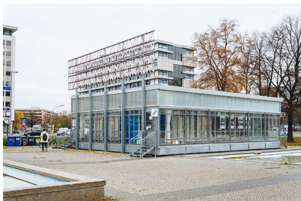
1. Pawilon BHROX bauhaus reuse na placu Reutera w Berlinie

Na wystawie przedstawiono postery z fotografiami i opisami wielu budynków modernistycznych Gdyni, które zaprojektowali architekci żydowskiego pochodzenia. Oprócz tego wystawiono oryginalne detale z dwóch ukazanych na ekspozycji budynków tj. kamienicy przy ul. Abrahama 28 oraz budynku biurowo-magazynowego firmy „Bananas” przy ul. Polskiej 19. Ekspozaty takie jak np. klamki, pochwyt, płytki okładzinowe, fragmenty posadzek i tynków, zostały wypożyczone na wystawę z Biura Miejskiego Konserwatora Zabytków w Gdyni. W czasie trwania wystawy odbyła się także prelekcja i dyskusja z udziałem przedstawicieli miasta Gdyni.