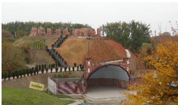
1. Widok „muszli koncertowej” w 2013 r.

U podnóża istniała wcześniej „muszla koncertowa” – pierwotnie żelbetowa, z czasem obudowana ceglami, fatalnie nawiązując do historycznych form. Szpeciła otoczenie zabytkowych ruin Zamku Książąt Mazowieckich (ryc. 1).