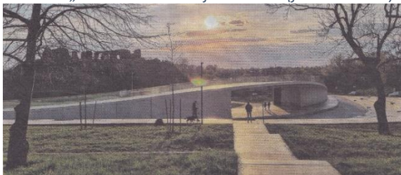
2. Projekt nowego amfiteatru („Ziemia Sochaczewska” nr 20/1421)

Władze i organizacje związane z lokalnym środowiskiem, doprowadziły do wykonania prac rewitalizacyjnych, z unijną pomocą finansową.